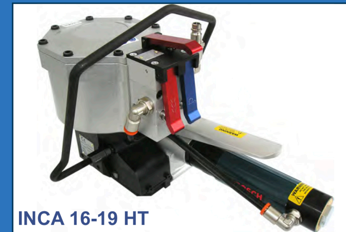
INCA 16-19 HT