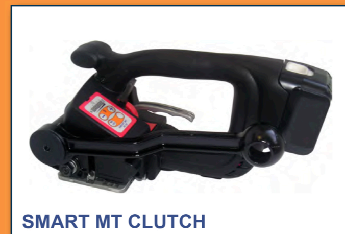
SMART MT CLUTCH