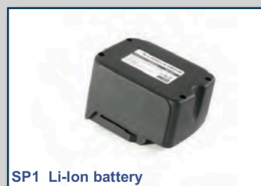
SP1 Li-Ion battery